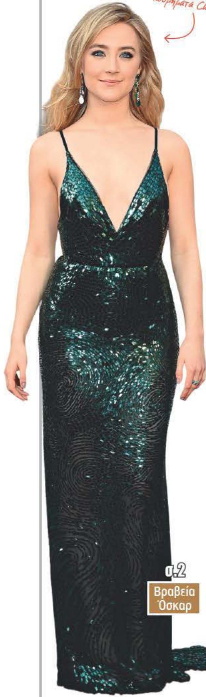
σ.2 Βραβεία Όσκαρ

Η Σίρσα Ρόναν με φόρεμα Calvin Klein Collection και κοσμήματα Chanel!