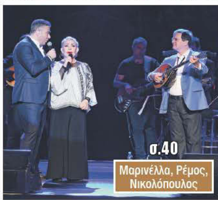
σ.40 Μαρινέλλα, Ρέμος, Νικολόπουλος