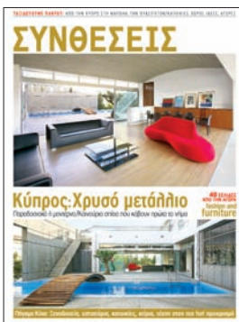
Λεζάντα εξωφύλλου: Κατοικία στη Λάρνακα από τους αρχιτεκτόνες Ελευθερία Σεργίδου - Βασίλη Πασιουρτίδη.