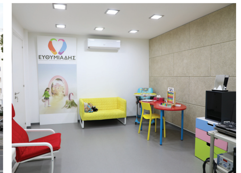
Από το 2015 έχουν λειτουργήσει και Παιδοακουολογικό Κέντρο παρέχοντας πλήρη διαγνωστική αξιολόγηση για παιδιά όλων των ηλικιών, από 0 - 16 ετών.