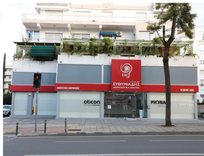
Το Ακουολογικό Κέντρο Ευθυμιάδης στη Λευκωσία (Δημοσθένη Σεβέρη 19). Η Εταιρεία διαθέτει επίσης Ακουολογικά Κέντρα στα Λαϊσιά, τον Αστρομερίτη, τη Λεμεσό, τη Λάρνακα, την Πάφο και το Παραλίμνι.