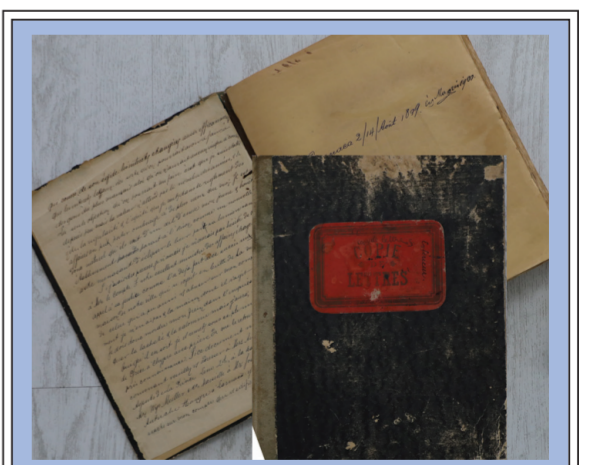
Βιβλίο με την καταγραφή των εργασιών της Εταιρείας με στοιχεία των πρώτων ετών λειτουργίας της.