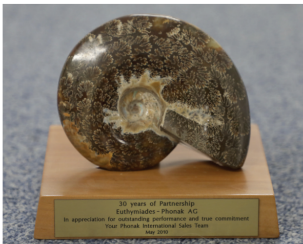
Τα Ακουολογικά Κέντρα Ευθυμιάδης συνεργάζονται με τον κορυφαίο κατασκευαστή ακουστικών συστημάτων Phonak, πέραν των 40 χρόνων. Στη φωτογραφία αναμνηστικός κοχλίας από την επιβράβευση των Κέντρων από την ελβετική βιομηχανία και πιστοποιητικό της Oticon από τη Δανία. Συνεργάζονται επίσης με τη Δανέζικη Interacoustics.

Σύντομα η πανδημία θα βρίσκεται στο παρελθόν και η ζήτηση υπηρεσιών και προϊόντων θα αυξηθεί ξανά. Είναι σημαντικό μια επιχείρηση να αντέξει, να διαμορφωθεί ανάλογα, και να είναι έτοιμη για καλύτερα και πιο επιθυμητά αποτελέσματα.