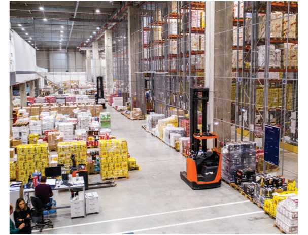
Υπεράσύγχρονο κέντρο αποθήκευσης και διανομής προϊόντων στην αγορά της Ρουμανίας.