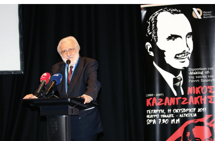
Στιγμιότυπο από την τιμητική εκδήλωση προς τιμήν του μεγάλου σκνποθέτη Γιάννη Σμαραγδή.

Στόχος, η δημιουργία προστιθέμενης αξίας προς όλους