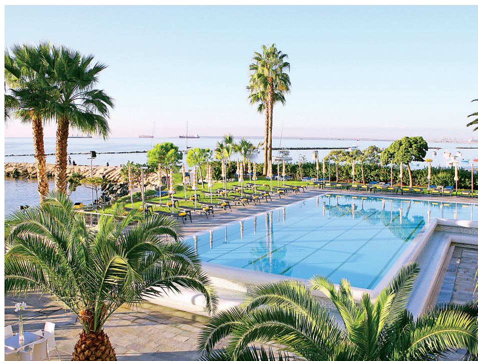
Η επέκταση του Ομίλου το 1975 στη Ξενοδοχειακή βιομηχανία και η συνεργασία franchise το 1999 με το InterContinental Hotels Group (IHG) θεωρούνται σταθμός στην πορεία του Ομίλου, σημειώνει η κ. Καραντώκη. Πάνω το Crowne Plaza Limassol, το οποίο έχει βραβευθεί αρκετές φορές από το IHG.

Μεταφέρει την ιστορία του τόπου μας. Υπάρχουν πολλές επιχειρήσεις που ιδρύθηκαν