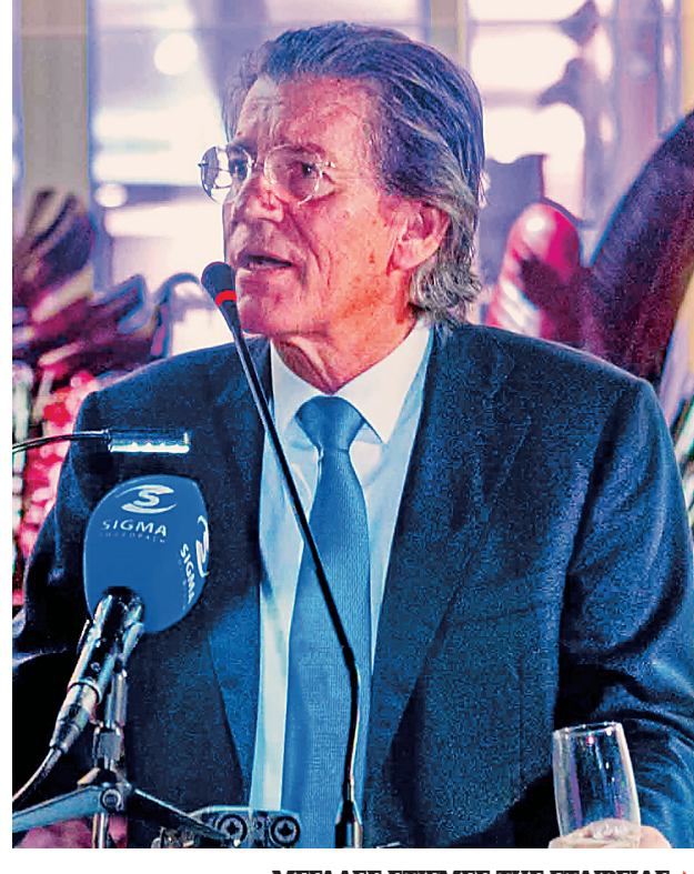
ΜΕΤΑΛΕΣ ΣΤΙΓΜΕΣ ΤΗΣ ΕΤΑΙΡΕΙΑΣ