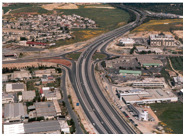
Κατά την κατασκευή του ανισόπεδου κυκλικού κόμβου Στροβόλου η Medcon χρησιμοποίησε αρκετές καινοτόμες λύσεις.