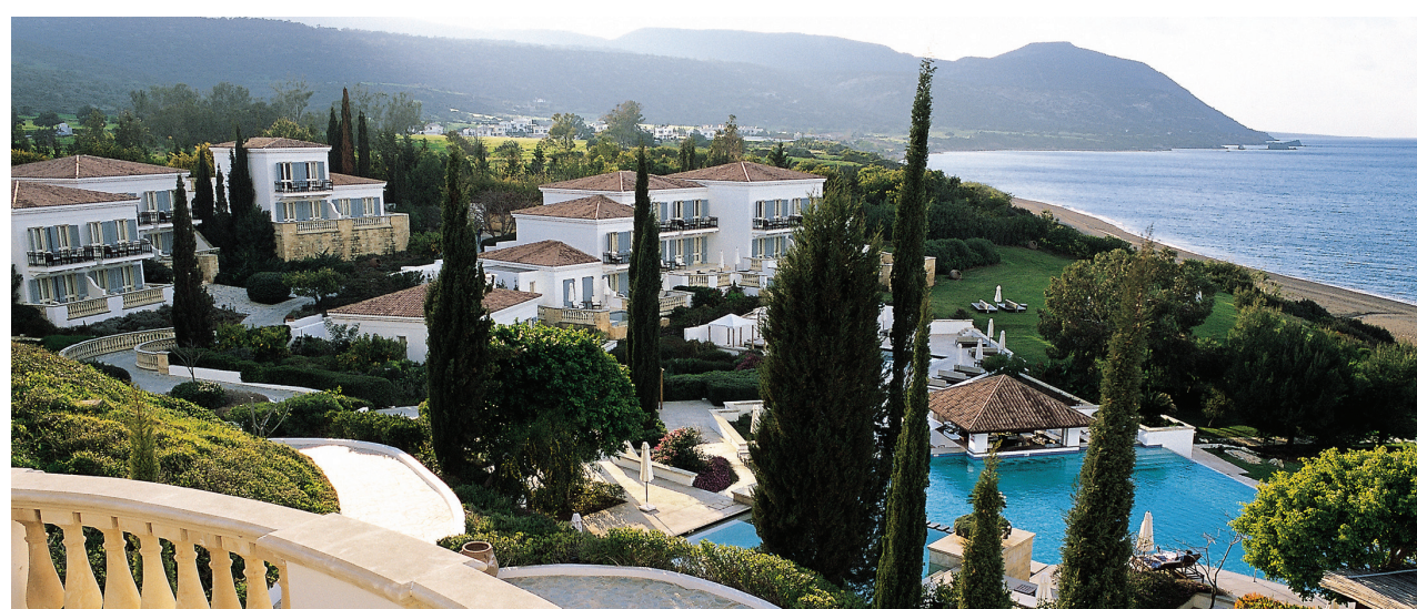
Τρία υπερπολυτελή ξενοδοχεία ανήκουν στον Όμιλο Thanos Hotels and Resorts. Στη φωτογραφία το εμβληματικό Anassa.