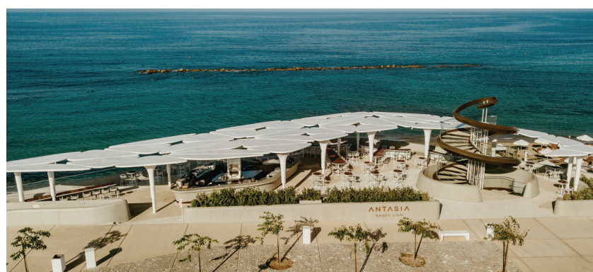
Φωτογραφίες από ξενοδοχεία του Ομίλου. Πάνω πανοραμική άποψη του Antasia, αριστερά το Anassa και δεξιά το Almyra.