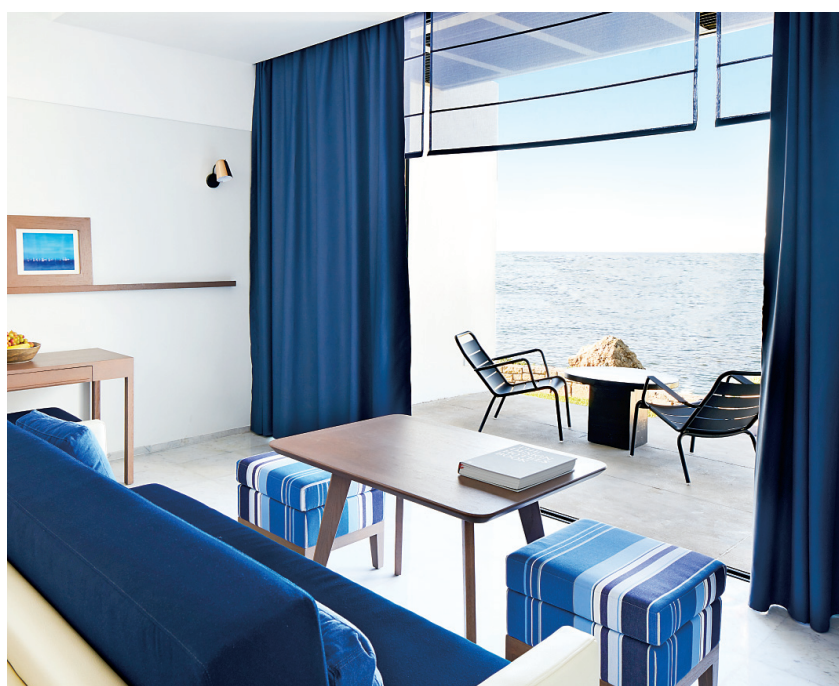
Το ξενοδοχείο Almyra είναι το μοναδικό που είναι μέλος των Design Hotels και λειτουργεί και ως πολιτιστικός προορισμός.