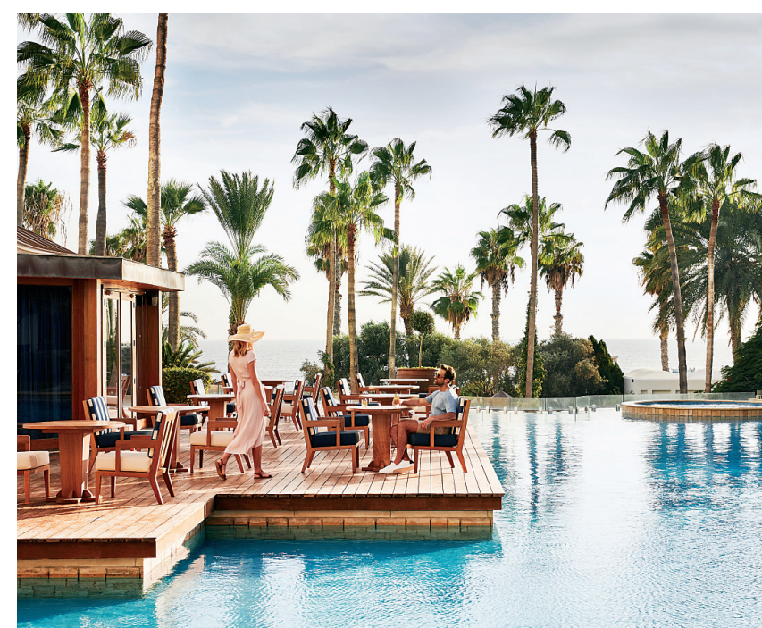
Το Annabelle ήταν το πρώτο ξενοδοχείο 5 αστέρων στην Πάφο.