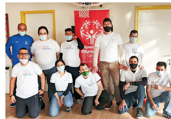
Η Toyota Κύπρου είναι δίπλα στους αθλητές των παραολυμπιακών και ειδικών ολυμπιακών αγώνων.