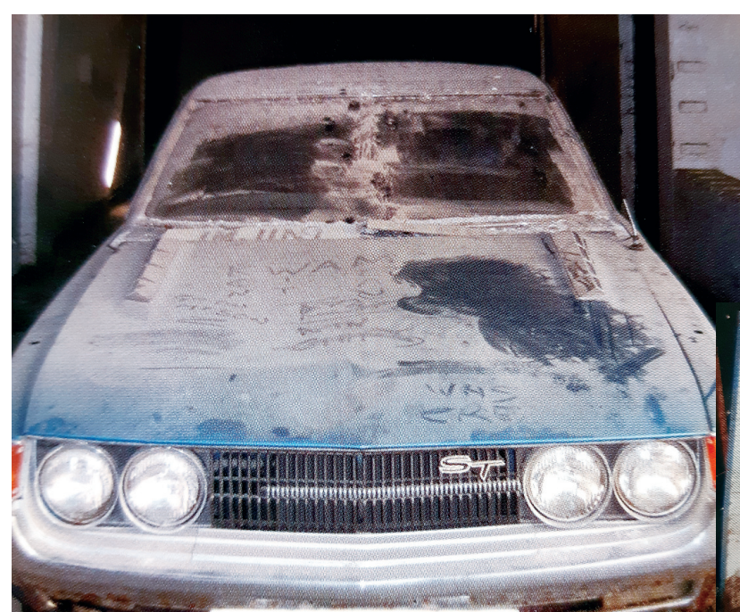
Συνολικά 51 αυτοκίνητα Toyota βρίσκονται εγκλωβισμένα από το 1974 στις εγκαταστάσεις της Dickran Ouzounian & Sias Ltd, στην πράσινη γραμμή.

Η εκδήλωση διοργανώθηκε στις 7 Ιουνίου στον χώρο του ΓΣΠ στη Λευκωσία όπου ένας εκπληκτικός αριθμός 742 αυτοκινήτων ολοκλήρωσαν επιτυχώς τη διαδρομή της παρέλασης που ήταν 3,8 χλμ. Το προηγούμενο ρεκόρ κατείχε η Toyota της Δανίας με 426 οχήματα.