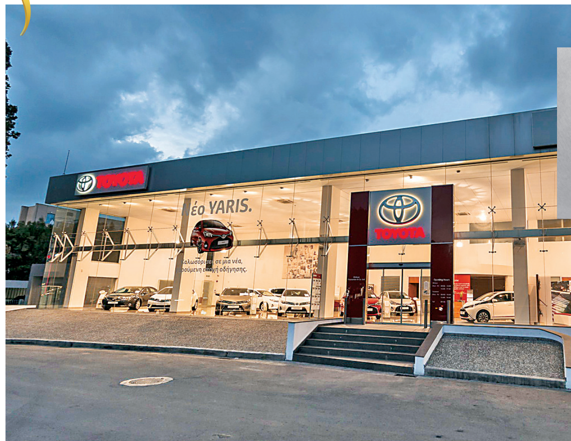
Τα κεντρικά γραφεία της Toyota στη Λευκωσία. Η εταιρεία διαθέτει δικά της γραφεία σε όλες τις επαρχίες.